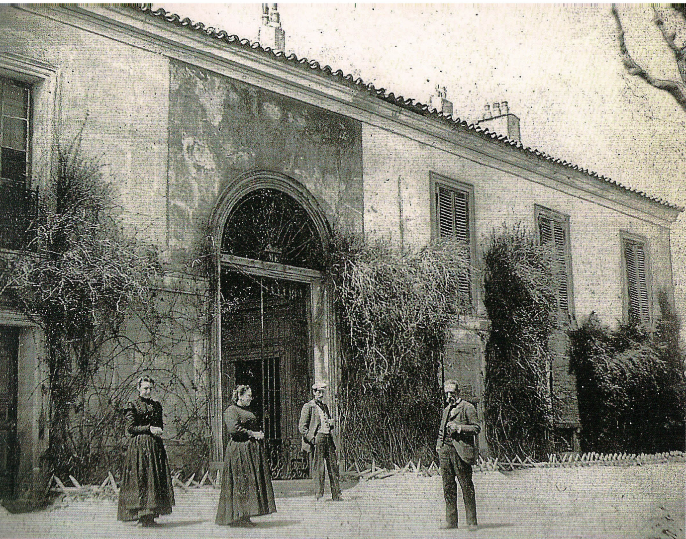
Imagen de la Quinta del Sordo, cuyas paredes Goya pintó sus famosas pinturas negras

En 1605, la Cofradía de Portereros del Ayuntamiento de Madrid fundó, junto al camino de Extremadura, una ermita bajo la advocación del Santísimo Cristo del Camino. En ella colocaron una imagen del Ángel de la Guarda procedente de la desaparecida puerta de Guadalajara, que en 1582 sufrió un incendio. La ermita comenzó a conocerse por la advocación del Ángel de la Guarda, y las huertas colindantes, así como la puerta de la Real Casa de Campo, adoptaron este nombre.