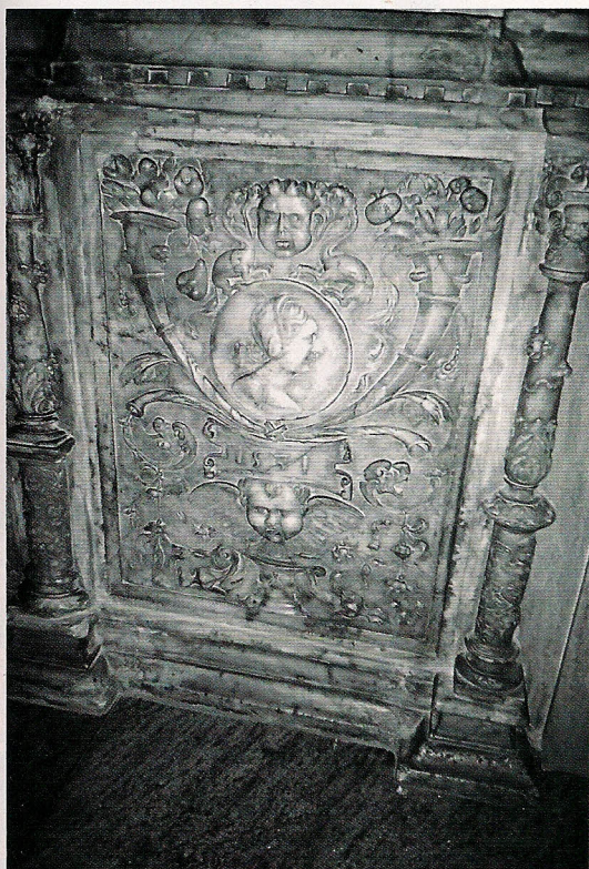
La otra pareja de sepulcros coetánea de la anterior y que se encuentra en el convento de la Concepción Jerónima, en El Goloso.

El nombre del distrito se debe a Beatriz Galindo (Salamanca, 1465-Madrid, 1534), escritora y humanista que fue profesora de latín de Isabel la Católica y sus hijos, de ahí el sobrenombre de la Latina. Fue llamada a la corte en 1489 y el cronista Gonzalo Fernández de Oviedo la describió como: «Muy grande gramática y honesta y virtuosa doncella hijadalga; y la Reina Católica, informada de esto y deseando aprender la lengua latina, envió por ella y enseñó a la reina latín, y fue ella tal persona que ninguna mujer le fue tan acepta de cuantas Su Alteza tuvo para sí».