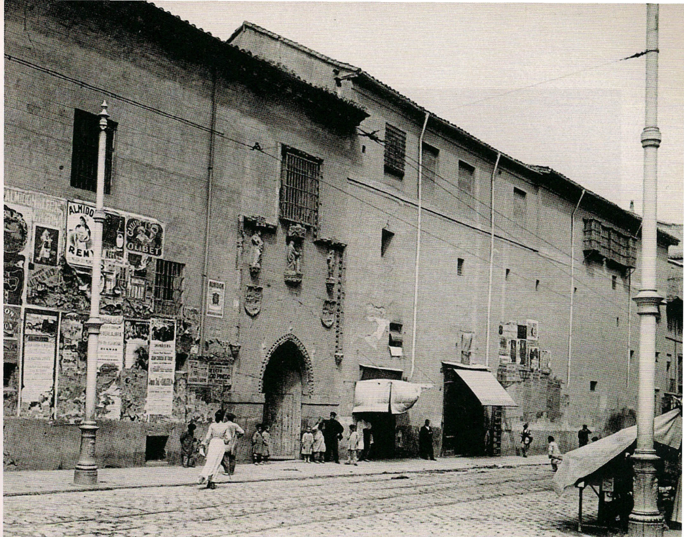
El convento y hospital de la Latina, en la calle Toledo, antes de su derribo. Hacia 1900

Madrid a Almorox, y que recorría el territorio del actual distrito de Latina. Su nombre es un recuerdo a la quinta de Goya, que se levantaba en sus cercanías y fue demolida en 1913.