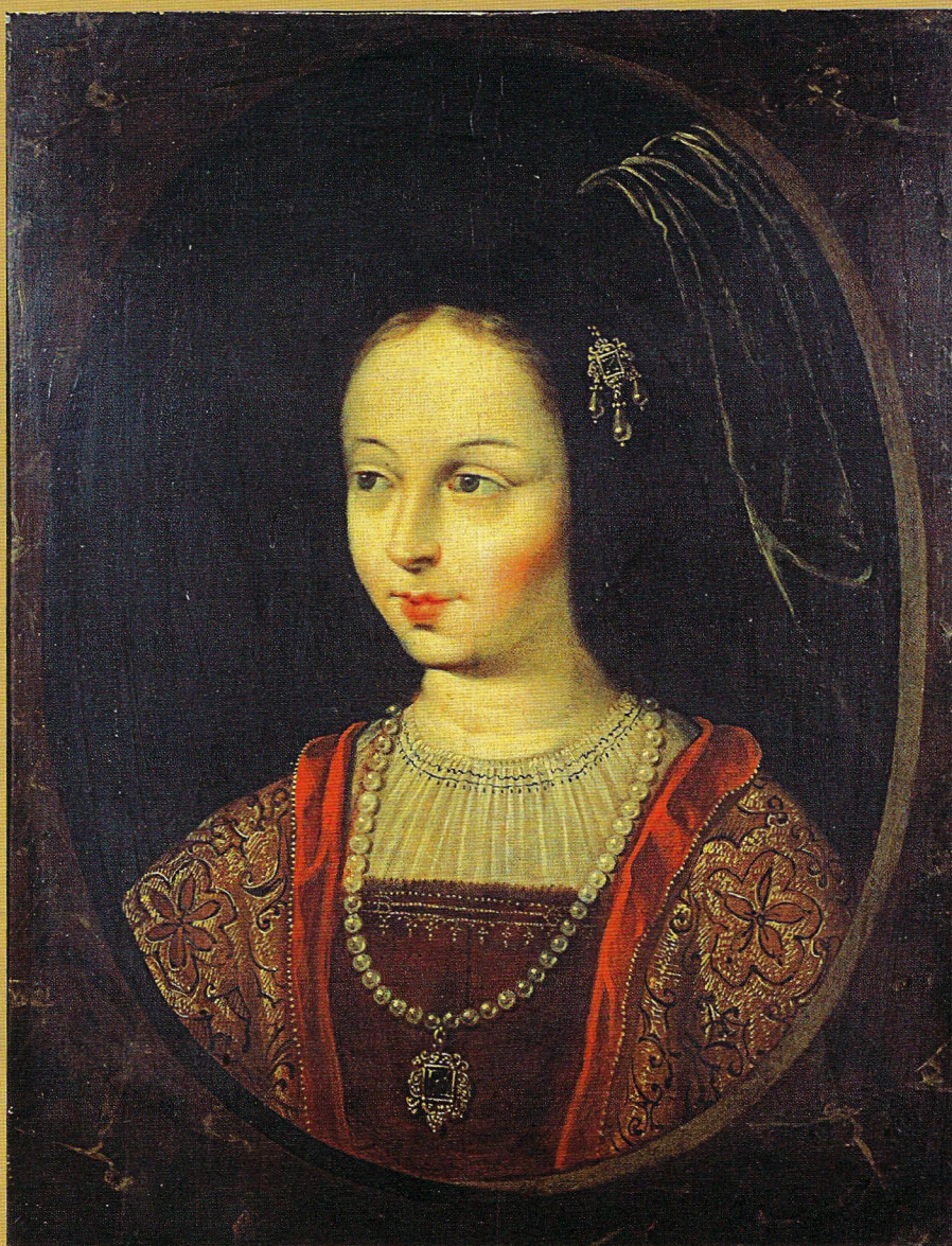
Retrato de Beatriz Galindo, la Latina